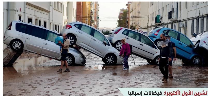
تشرين الأول (أكتوبر): فيضانات إسبانيا