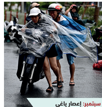
سبتمبر: إعصار ياغي