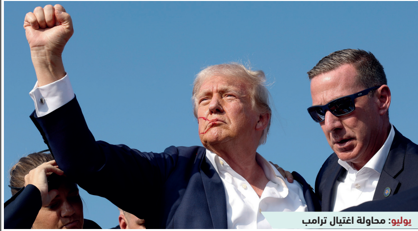
يوليو: محاولة اغتيال ترامب