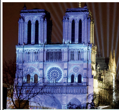
ديسمبر: كاتدرائية نوتردام