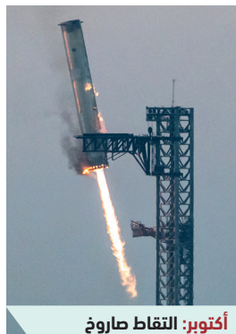
أكتوبر: التقاط صاروخ