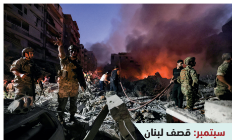
سبتمبر: قصف لبنان