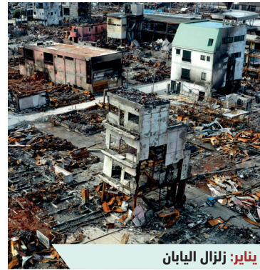
يناير: زلزال اليابان