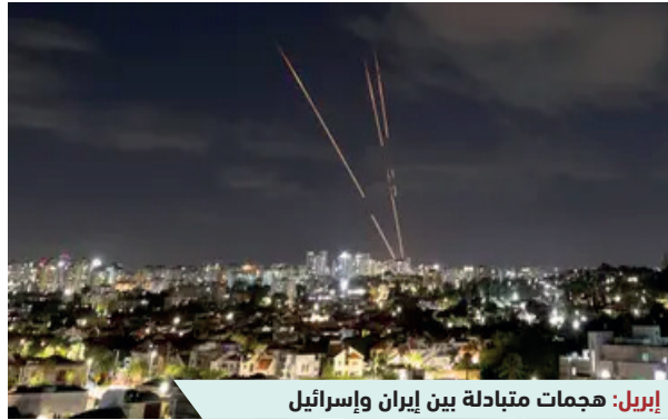
إبريل: هجمات متبادلة بين إيران وإسرائيل