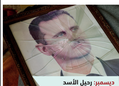
ديسمبر: رحيل الأسد