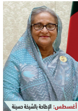
أغسطس: الإبادة بالشيخة حسينة