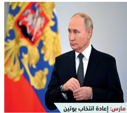
مارس: إعادة انتخاب بوتين