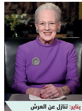
يناير: تنازل عن العرش